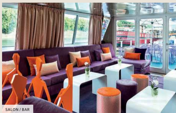
SALON / BAR