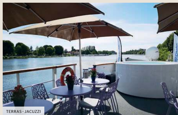
TERRAS - JACUZZI

De MS Raymonde is een prachtige 5-anker schip, dat 38,50 meter lang en 5,07 meter breed is. Het schip kan 22 passagiers in 11 kajuiten op twee dekken verwelkomen. Elk van hen, met een oppervlakte van 9 m 2 (inclusief een kajuit voor gehandicapten van 11 m 2 ), hebben alle voorzieningen en biedt de beste verblijfsvoorwaarden aan. Aan boord werd elk detail verzorgd en de 6 bemanningsleden garanderen een persoonlijke service. De inrichting is goed verzorgd en de sfeer van het interieur, zowel elegant als intiem, is in perfecte harmonie met zijn omgeving. Gelegen op het bovendek, het restaurant, waar alle