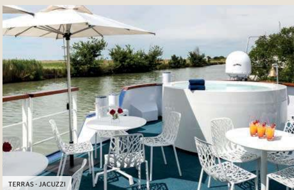
TERRAS - JACUZZI

De MS Anne-Marie is een prachtig schip met 5 ankers op menselijke schaal, 38,50 meter lang lang en 5,07 meter breed. Het is geschikt voor 22 passagiers, in 11 kajuiten verdeeld over twee dekken.