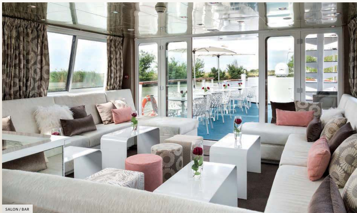
SALON / BAR

Een cruise aan boord van een binnenschip is een rustgevende pauze waarin u de tijd neemt om het “zoete Frankrijk” op een andere manier te ontdekken. De MS Anne-Marie, een ware cocon van charme, vaart op de Franse kanalen en biedt zijn passagiers een originele, spannende en authentieke ervaring.