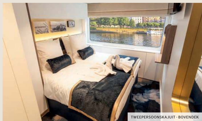
TWEEPERSOONSKAJUIT - BOVENDEK

(1) PRM: persoon met een beperkte mobiliteit.