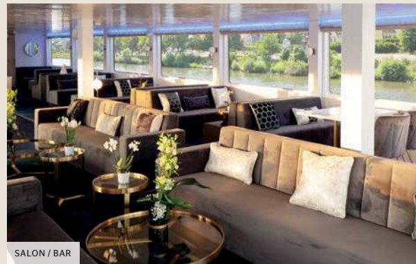
SALON / BAR

Volledig gerenoveerd in 2019, de MS Victor Hugo is een 4-anker schip op menselijke maat, van 82 m lang en 9,50 m breed. Het biedt plaats aan 90 passagiers in 45 kajuiten verdeeld over twee dekken. Elk van hen heeft alle voorzieningen. Elke kajuit is voorzien van alle gemakken en biedt de beste verblijfsomstandigheden aan.